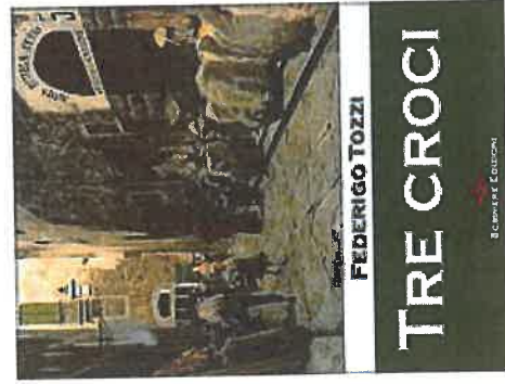
Tozzis roman "Tre croci" i nyeste udgave.