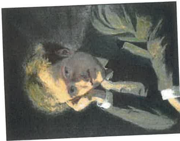
Federigo Tozzi (Ukendt kunstner)

En fra denne kreds var digteren og forfatteren Federigo Tozzi (1883-1920), som på det religiøse dog siden kom til at adskille sig lidt fra de øvrige, idet han bl.a. som Jørgensen var optaget af den hellige Katerina men senere også kom ud i nogle svære samvittighedskvaler, som bragte ham tilbage til kirken. Herved kan man sige, at hans skæbne på sæt og vis kom til at minde lidt om den unge Jørgensens omvendelsesproces. Men ifølge Jørgensens dagbog praktiserede Tozzi imidlertid ikke sin religion i de år, hvor de omgik hinan- den i Siena – han er "... uden altfor mange moraliske Skruper" skriver Jørgensen til