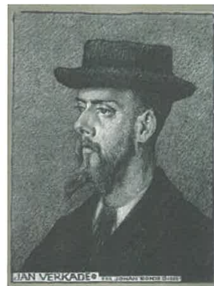
Verkade tegnet af Johan Rohde

Den 3. februar 1894 kom en ung hollandsk kunstner til København; hans navn var Jan Verkade. Han var inviteret af sin danske ven Mogens Ballin, "en israelit fra København", som Verkade havde lært at kende i Paris i 1891, hvor de begge gik med kunstnerdrømme. De havde truffet hinanden første gang ved en "banquet Gauguin" – en afskedsfest for mesteren, der havde solgt så mange billeder, at han nu kunne realisere sin drøm om at rejse til Tahiti. Festen fandt sted den 23. marts 1891 på "Café Voltaire". (Verkade 1954, s. 77f.)