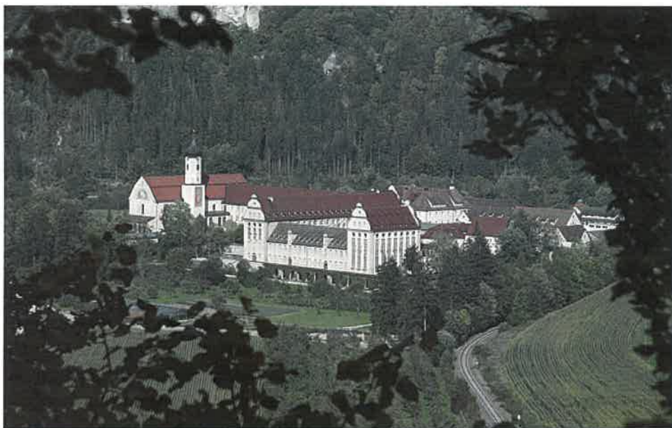
Benediktiner abbediet ved Beuron.